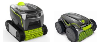
Robot Robot GT3220/GV3420