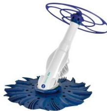
Limpiafondos automático Automatic cleaner 90397